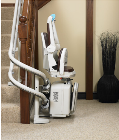
Einbau - Beispiele